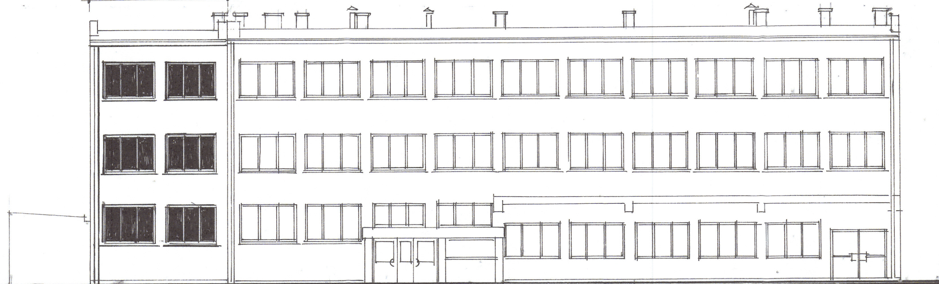
ELEWACJA PÓŁNOCNO ZACHODNIA