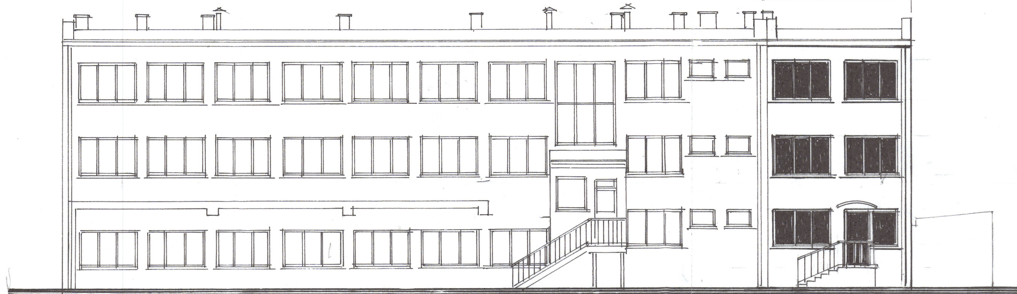
ELEWACJA POŁUDNIOWO - WSCHODNIA